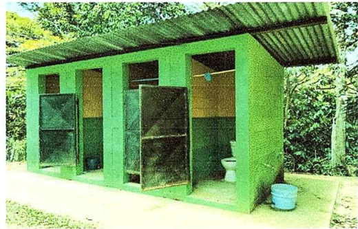
FOTO 4: Puerta de los baños en mal estado, las tazas y los accesorios inservibles