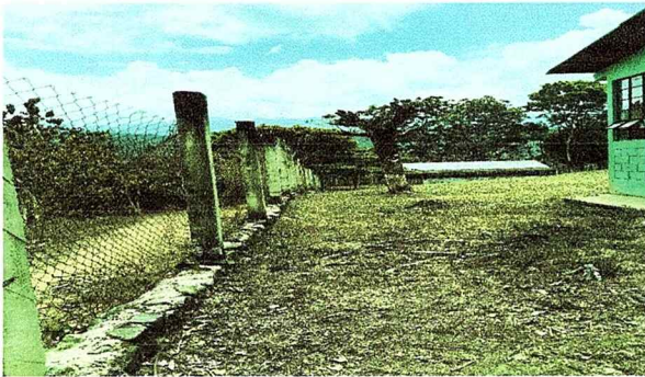
FOTO 5: Area del perímetro del lugar del establecimiento no se encuentra bien cerrada