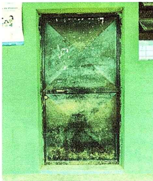
FOTO 3: Puerta despintada y rayada, chapas y visagras en mal estado